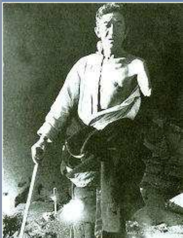
Leibeigener, dem ein Arm abgehackt wurde

Die religiösen Unterweisungen der Theokratie waren ein Eckpfeiler ihrer Klassenherrschaft. Den Armen und Leidgequälten wurde gesagt, daß sie an ihren Problemen selber Schuld seien wegen ihrer Verfehlungen in vergangenen Leben. Sie hatten das Elend ihres gegenwärtigen Lebens als karmische Sühne zu akzeptieren in der Erwartung einer Verbesserung ihres Loses in einem nächsten Leben. Die Reichen und Mächtigen sahen ihr gutes Schicksal als Belohnung an und als unbezweifelbaren Beweis für ihr tugendhaftes vergangenes und gegenwärtiges Leben.