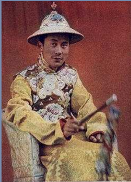
Feudalherr Dalai Lama 1956

Viele Buddhisten glauben, daß das alte Tibet vor den chinesischen Unterdrückungsmaßnahmen 1959 ein spirituell ausgerichtetes Königreich war, das frei war von egoistischer Lebensführung, frei war von Materialismus sowie vom Laster der Korruption, das in westlichen Gesellschaften verbreitet ist. Westliche Medien, Reiseberichte, Novellen und Hollywoodfilme zeigten der Öffentlichkeit die tibetische Theokratie als ein veritables Shangri-La. Der Dalai Lama erklärte, „dass der fortwährende Einfluß des Buddhismus“ in Tibet, „inmitten den Weiten einer unberührten Natur eine Gesellschaft schuf, die sich dem Frieden und der Harmonie verschrieb. Wir genossen Frieden und Zufriedenheit“