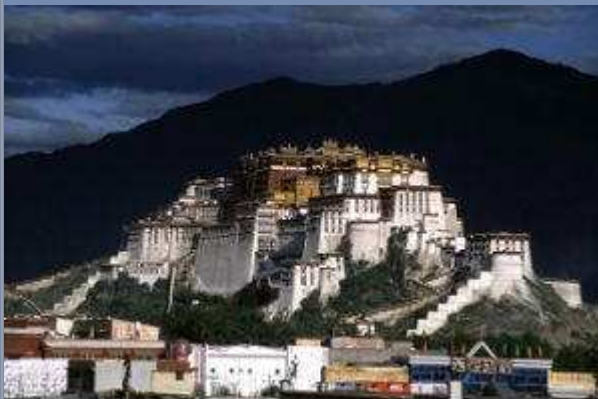
Der Potala: Zwingburg des Dalai Lama

Religionen hatten nicht nur eine enge Beziehung zu Gewalttätigkeiten sondern auch zu ökonomischer Ausbeutung. Tatsächlich ist es oft die ökonomische Ausbeutung, die die Gewalttätigkeiten bedingt. So verhielt es sich bei der tibetischen Theokratie. Bis 1959, als der Dalai Lama immer noch Tibet vorstand, befand sich fast das ganze bewirtschaftbare Land in Großgrundbesitz, auf dem Leibeigene arbeiteten. Diese Güter standen im Besitz von zwei Gruppen: reiche säkulare Fürsten und reiche theokratische Lamas. Sogar ein Autor, der mit der alten Ordnung sympathisiert muß zugeben, daß „ein großer Teil des Grundbesitzes den Klöstern gehörte und die meisten großen Reichtum anhäuften“. Ein großer Teil des Reichtums wurde angehäuft „durch aktive Teilhabe an Handel, Wirtschaft und Geldverleih“.