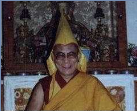
Dalai Lama: Chef der Gelbhutsekte

von ihnen, sogar ihre Namen zu vernichten“