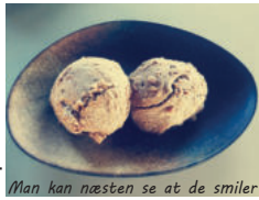
Man kan næsten se at de smiler