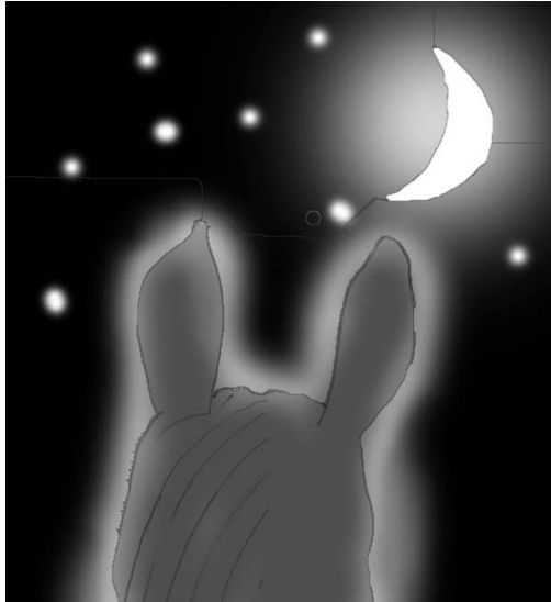
bleg glød, måne og stjerner

Stien, stenet eller glat, jeg ved det ikke, jeg svæver over dens mørke, intet lys. Hesten skridter selvsikkert ind i mørket, uforstyrret mellem skygge og måneskin.