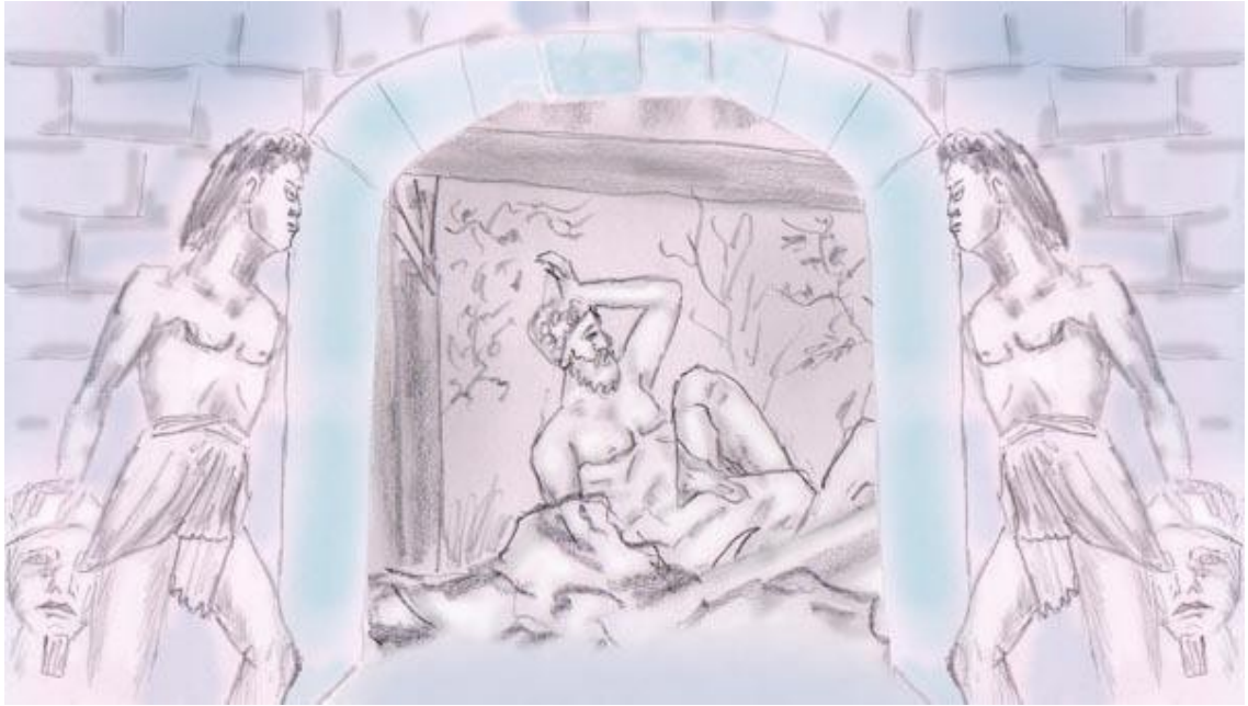
Billede fra en drømmeby

Når du er tæt på mig, udfolder min fantasi sig kreativt. Husene i mine drømme er smukt designet som paladser. Jeg var i stand til at opleve en gåtur med os to i aften. Du var tæt på mig, det var smukt og gav mig meget.