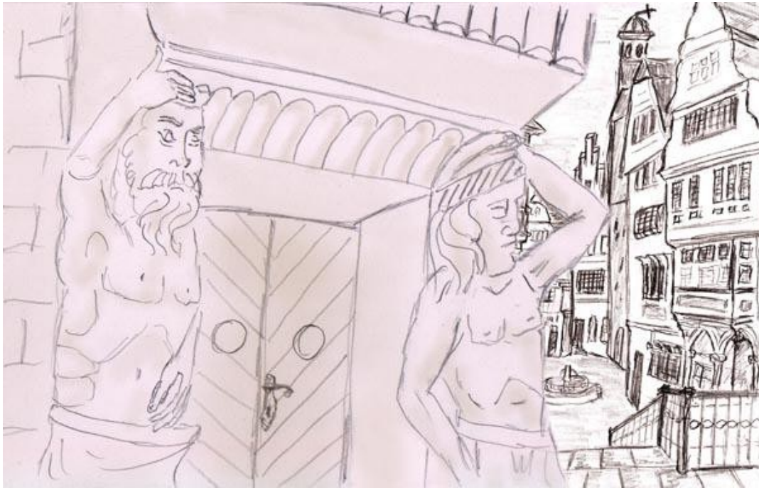
Billede fra en drømmeby

I drømme har jeg mødt denne opfattelse i henført kærlighed for første gang. Det kan skyldes, at man i drømme er mere åben og ikke kommenterer alt logisk og skeptisk. Det må have taget mange år for mit følelsesliv at blive tilstrækkeligt forfinet i hverdagen til, at jeg kunne se verden omkring mig i henført kærlighed. Det så nogenlunde sådan ud: