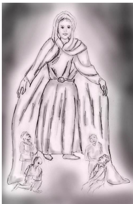
Jomfru af beskyttelse

Interessant nok fandt jeg en sådan middelvej antydet i kristendommen, nemlig i Vor Frue som All-Moder, som passende portrætteret, for eksempel, i Jomfruen med den beskyttende kappe.