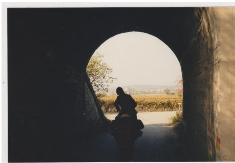
Udsigt gennem tunnelen

Man skal være i stand til at give slip indadtil, hvis man vil ekspandere. Man skal kunne betro sig til en indre vejledning. Hvordan kan man modtage noget, hvis man samtidig lukker sig om sig selv?