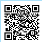
Facts om bivirkningerne