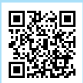
Facebook skjuler sandheden