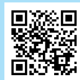
Advarsel fra læger