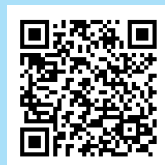
Læger vidner i retten