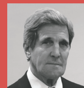
John Kerry USAs særlige klimaudesting