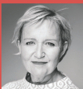
Tine Gøtzsche Konferencier og journalist