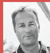
Kasper Hjulmand Danmarks landstræner A-landshold i fodbold