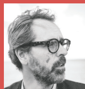
Anders Morgenthaler Tegner, forfatter og filminstruktør