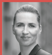
Mette Frederiksen Statsminister