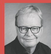
Ulrik Wilbek Borgmester i Viborg Kommune og formand for KL's Socialudvalg